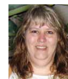
Af Vibeke Rathmann

længst tid. Vedtægtsændringer fra bestyrelsen og rigtig mange fra "oppositionen", vedtægtsændringerne gav en lang debat med stor talelyst, og de ændringsforslag som bestyrelsen havde givet blev vedtaget med overvejende majoritet, hvor de mange ændringsforslag fra "oppositionen" slet ikke blev vedtaget.