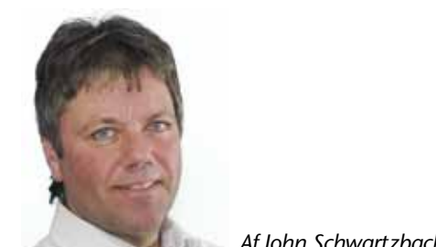
Af John Schwartzbach

Dansk Metal Tele Øst Lyngsiehus Nyropsgade 25 3. sal 1780 København V